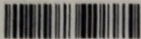
PhotoScan de Google Fotos